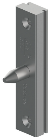
Kołki zabezpieczające na krótkiej bazie