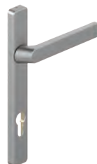
82602(C)(L) (VI) 82612(C)L VI