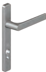
82700(C)L (VI) 82700S(P)L VI 82700HPL VI 82710(C)L (VI) 82710S(P)L VI 82710HPL VI