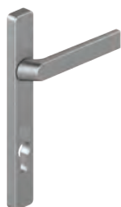
82702(C)L (VI) 82702S(P)L VI 82702HPL VI 82712(C)L (VI) 82712S(P)L VI 82712HPL VI