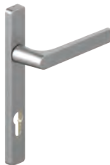
82600(C)(L) (VI) 82610(C)L VI