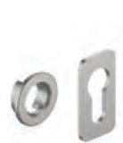
F1001039 F1001035 F1001036 F1001037 F1001038